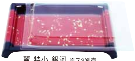
麗 特小 銀河 ※フタ別売