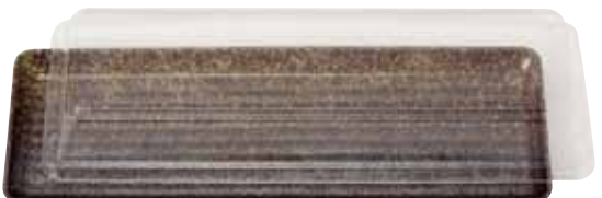
工芸陶器黒 ※フタ別売