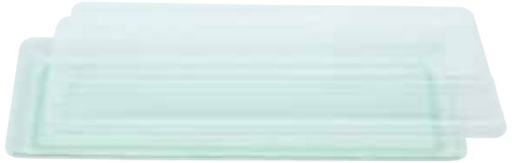
エメラルドグリーン ※フタ別売